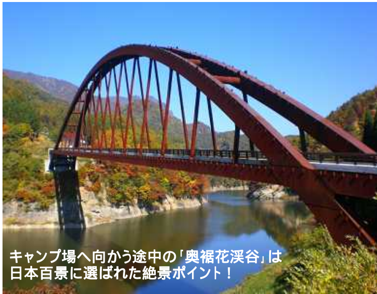
キャンプ場へ向かう途中の「奥裾花渓谷」は 日本百景に選ばれた絶景ポイント!