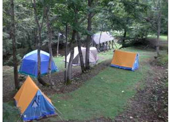
さわやかな高原でスローライフを満喫

オートキャンプ用サイト、テントサイトは 20区画! 炊事場1ヶ所、トイレ2ヶ所(洋式・和式 ともに有り)、シャワー室完備! 各種キャンプ用品、販売、貸し出し有り!